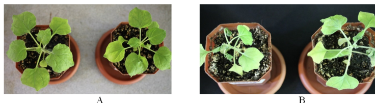
Сурет 3 – Nicotiana benthamiana TBSV (А) вирусымен инфекцияланған бірінші күн және жоғарғы температура мен вирустық инфекцияның аралас әсерінен кейінгі 8 күн. А – бірінші күні инфекцияланған өсімдік; В – температуралық стрестің және вирустық инфекцияның әсерінен кейінгі өсімдік

олардың түрі мен өсімдік-қожайыны әсер етеді. Жоғары температуралар TCV вирусының Arabidopsis өсімдіктерінің нақты репликациясына әкеледі және темекі мозайкасы вирусының немесе өсімдіктердің қорғаныс жүйелерінің әлсіреуі есебінен репа мозайкасы вирусының таралуын жеңілдетеді [5].