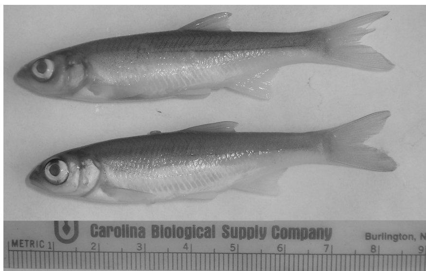
Рисунок 2 – Нормальное (вверху) и укороченное (внизу) рыло у жереха (годовалые особи).

Средние и максимальные значения коэффициента флуктуирующей асимметрии A_s у исследованных нами рыб были большими, что указывает на существенные нарушения гомеостаза индивидуального развития. Среди исследованных особей жереха были обнаружены фенотипы – особи с укороченным («мопсовидным») рылом (рисунок 2). Наличие подобных форм отмечалось у различных видов рыб в условиях загрязнения аквальных экосистем [6, 142-146 стр; 7].