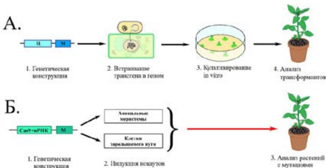
Рисунок 1. Основные этапы модификации генома растений с применением ДНК-технологий. А) модификация генома с применением генетической инженерии; Б) модификация геномов с применением геномного редактирования; Ц – целевой ген; М – маркерный ген; Cas9-нРНК – инструмент для геномного редактирования